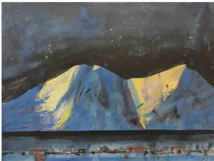
Opdahl Fram til 25. september kan du se Ørnulf Opdahls utstilling «Landkjenning» ved Kunstverket Galleri i Oslo. Her ser vi «Svalbard» fra 2018. perspektiv@klassekampen.no